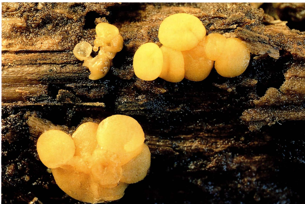
Phaeohelotium monticola (Berk) Dennis