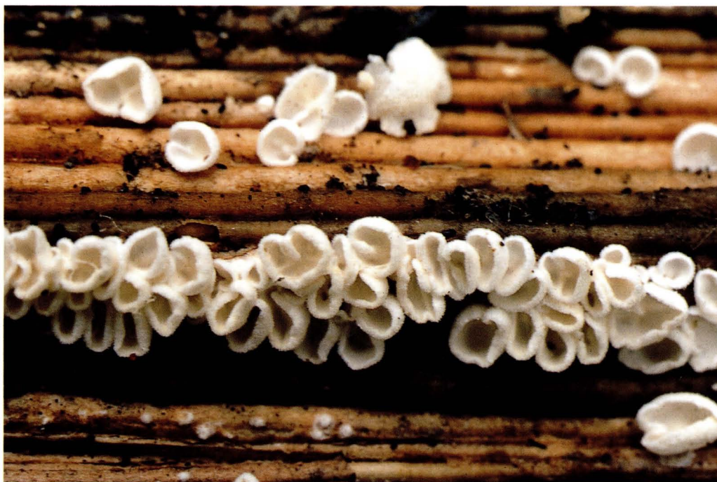
Cellypha goldbachii (Weinm.) Donk