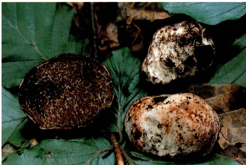
Octavianina asterosperma (Vitt.) O. Kuntze