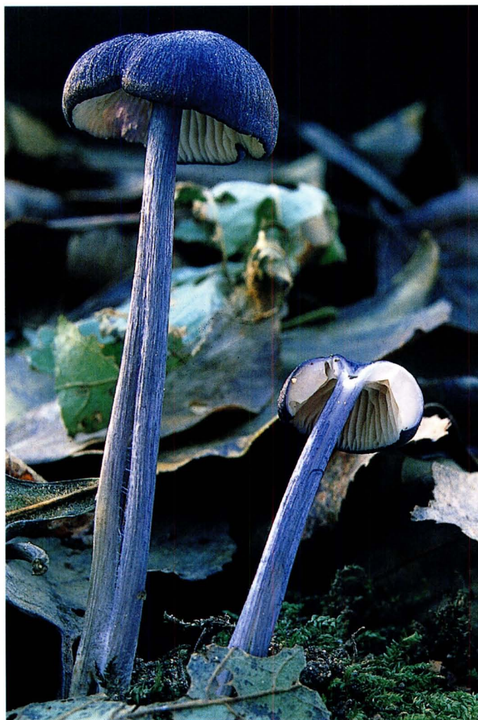
Entoloma pseudocoelestinum Arnolds