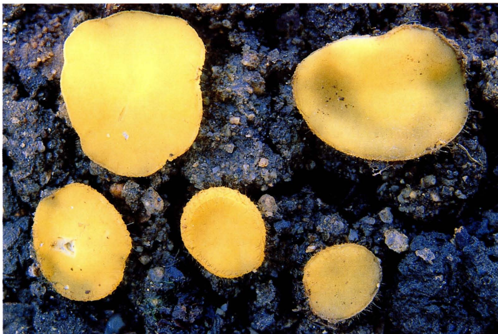
Cheilymenia vitellina (Pers.: Fr.) Dennis